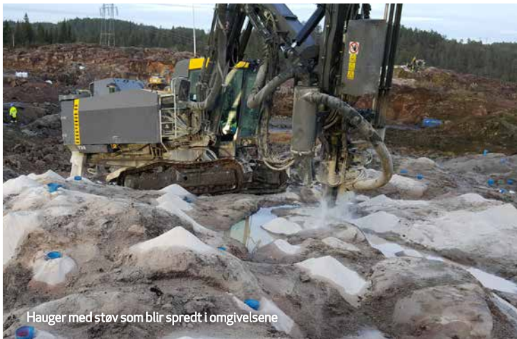
Hauger med støv som blir spredt i omgivelsene

* angir at det dreier seg om kreftfremkallende støv